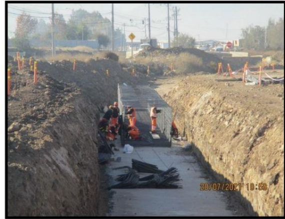
Preparación enfierradura O.A. N°5.