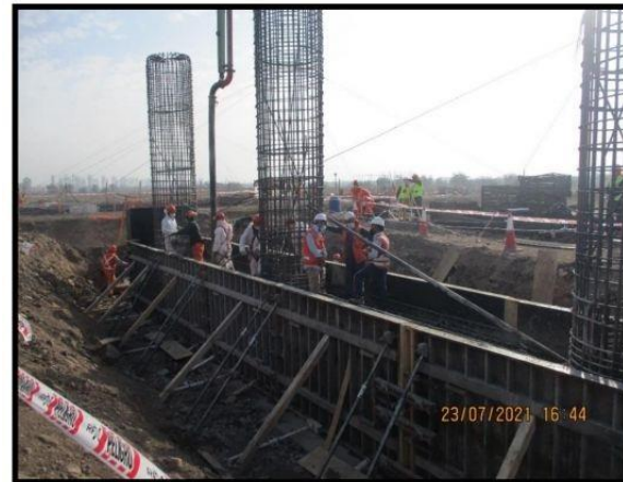
Hormigonado viga de amarre estribo salida P.S. Lo Marcoleta