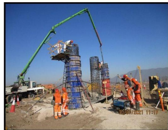
Hormigonado pilas 1 y 3 estribo salida P.S. Lo Marcoleta.