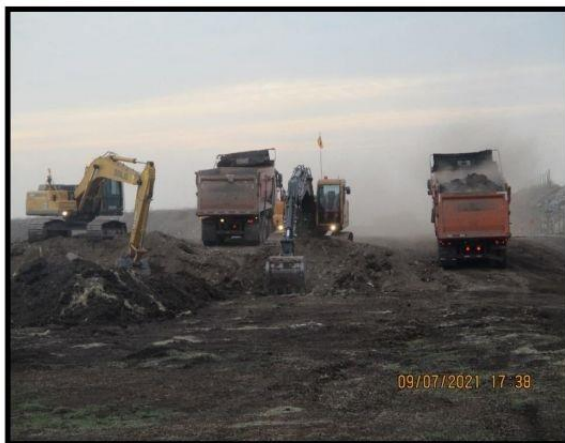
Remoción Material inadecuado Tramo 4